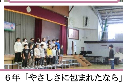
6年「やさしさに包まれたなら」