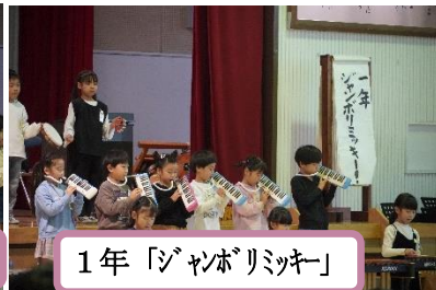
1年「ジャンボリッキー」