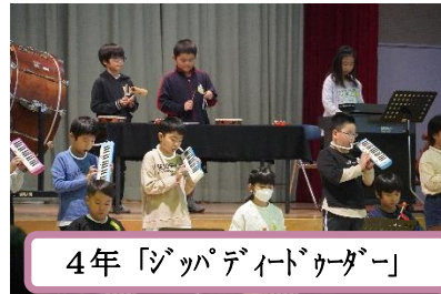
4年「ジップデイトゥーダー」