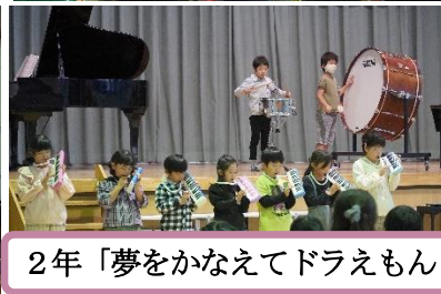
2年「夢をかなえてドラえもん」