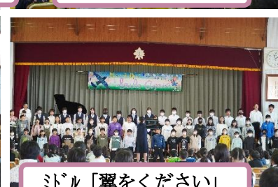
ミドル「翼をください」