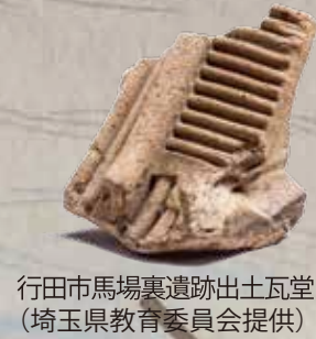
行田市馬場裏遺跡出土瓦堂

『埼玉県東部地区の奈良時代・平安時代』2,000円 春日部市郷土資料館、宮代町郷土資料館へ