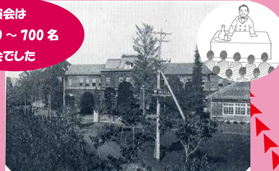
県立粕壁中学校