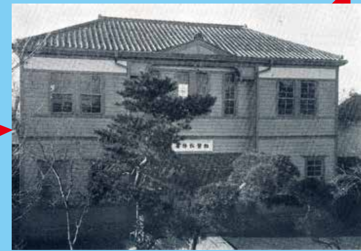
粕壁税務署