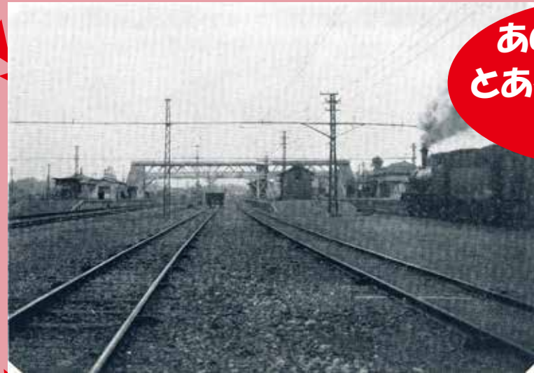
粕壁駅（『粕壁町誌』より）