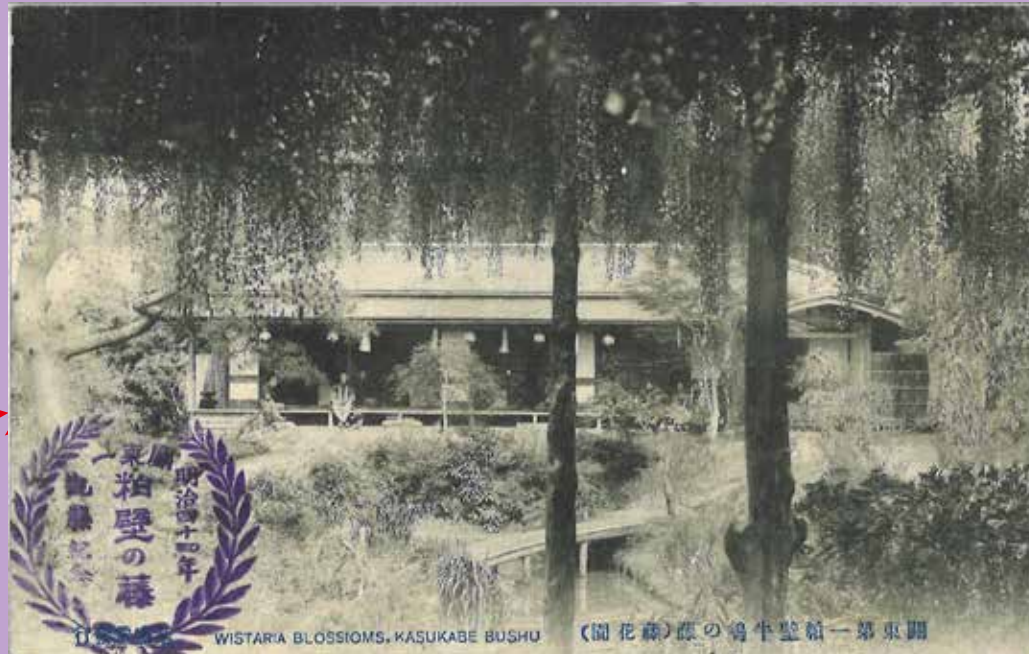
WISTARIA BLOSSOMS, KASUKABE BUSHU (開花藤) 藤の島牛壁第一東園