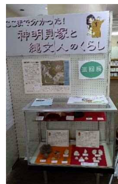
豊春地区公民館での巡回展示の様子