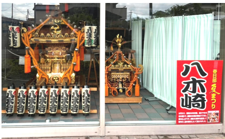
▲ 夜間はライトアップしています（閉館時まで）

※館内（ロビー）でもご覧いただけますが、学習スペースの利用者のご迷惑にならないようご注意ください。