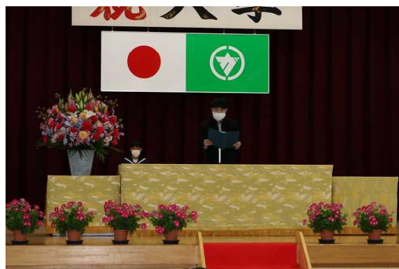
<1学期の誓いを発表する代表生徒>

どんな小さな努力でも、何かを達成しようとして努力を続けていく人と、何の行動も起こさない人とは、どれだけの差がつくのでしょうか。人生は、自分の小さな一歩から変わっていく。それぞれが今年度の自分の目標を明確にして、それに向かって努力してほしい。皆さんの頑張りを期待している。