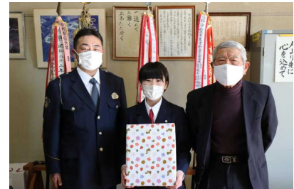
町ソルバードライブクラブ様からの贈呈物