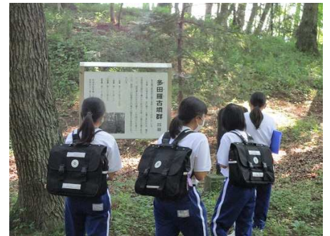
多田羅古墳群（町指定記念物）