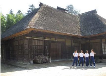
入野家住宅（国指定重要文化財）