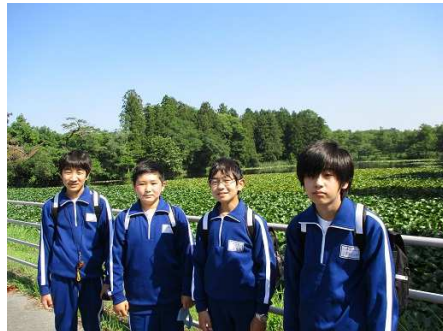
多田羅沼（県自然環境保全地域）