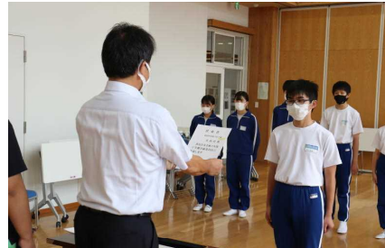
2学期学級委員任命