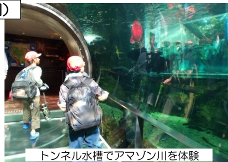
トンネル水槽でアマゾン川を体験