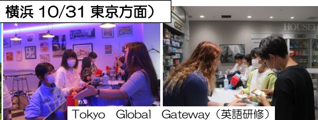
Tokyo Global Gateway（英語研修）