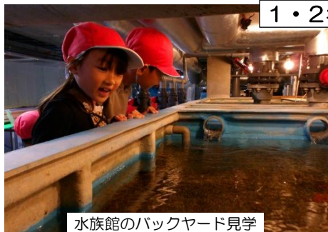
水族館のバックヤード見学