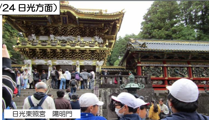
日光東照宮 陽明門