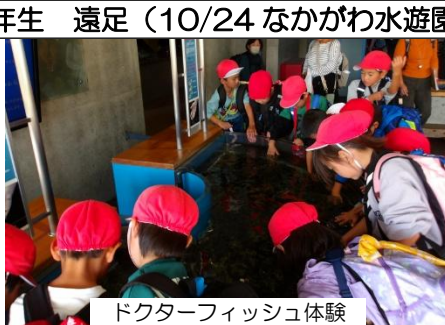
ドクターフィッシュ体験