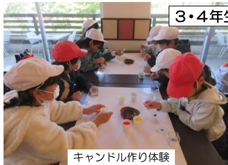
キャンドル作り体験