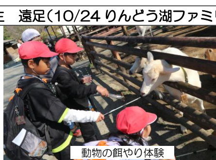
動物の餌やり体験