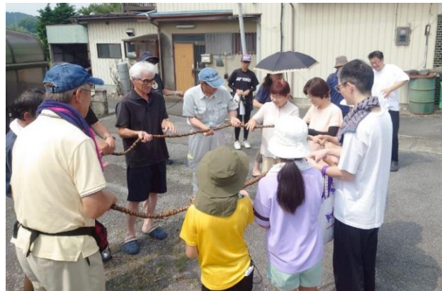
7月6日（日）に行われた古宿下町自治会の百万遍（大きな数珠を回して無病息災を祈る地域の伝統行事）のようすです。自治会内の本校児童も参加してイベントを盛り上げました。

町広報紙や自治会の回覧板などで情報を収集し、親子で参加を検討してみてもいいかもしれません。子供たちは人の役に立つ喜びを実感することで、自己有用感や責任感も育ちます。また社会貢献活動をすることで、社会の一員であるという意識の芽生えも期待できます。