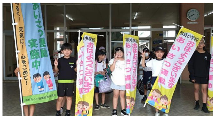
登校時のあいさつ運動中の代表委員

「あいさつ日本一を目指そう」と子供たちはあいさつ運動に力を入れており、子供たちの発案であいさつ運動の内容を検討したり、6年生が素敵なスローガンを作成したりしてくれました。