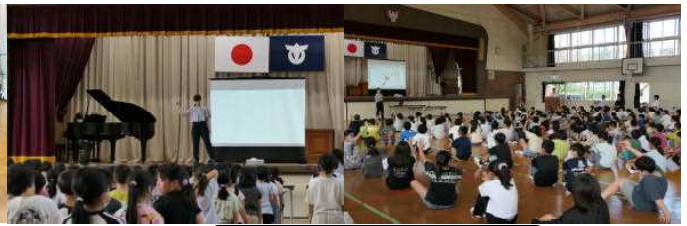
心を合わせて取り組んでいます