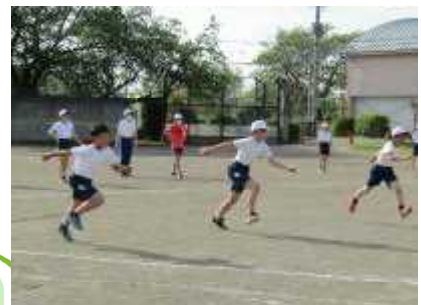
【陸上の練習始まる】