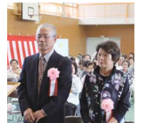
おめでとうございます！

町主催による「令和元年度広野町敬老会」が広野町中央体育館で盛大に開催されました。式典では、当協議会から町内最高齢者と満85歳以上の方252名に記念品を贈呈いたしました。余興では、モノマネショーとマジックショーで大いに盛り上がりました。