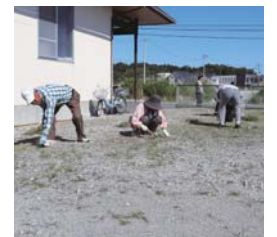
会員の皆さんありがとうございました

毎年9月は全県一斉奉仕活動の日となっており、町老人クラブ各単位クラブでは、会員たちが地区集会所周辺の草刈りや草むしり、ゴミ拾いなどを実施。県下一斉に実施される奉仕活動を通じて、住みよい町づくりを推進しています。参加された皆さんお疲れ様でした。