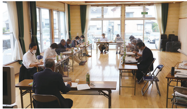
6月14日 理事会開催の様子

理事会・評議員会が開かれ令和2年度実施事業報告並びに収支決算報告が承認されました。