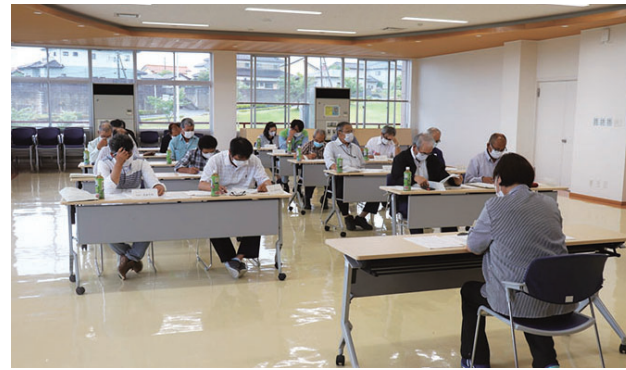
6月29日 評議員会開催の様子

また、6月30日評議員選任委員会が開催され評議員（行政区長）25名が再任されました。