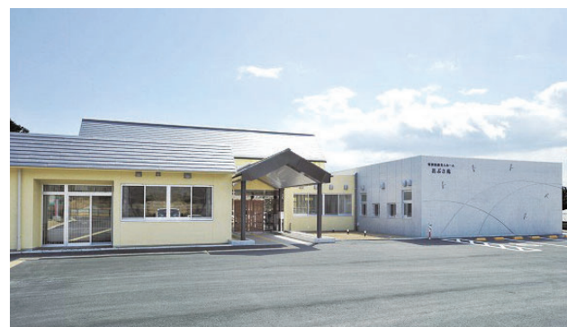
広野町特別養護老人ホーム花ぶさ苑

広野町社会福祉協議会が行うコロナ禍での地域福祉事業や介護保険事業（訪問・通所・包括）について、その事業実施状況を報告し、情報共有と今後の福祉サービスをよりよい事業にするための検討を行う「社協事業状況報告会」が6月9日、広野町役場において、会長、福祉担当課長、花ぶさ苑運営管理者、社協事業各管理者出席のもと開かれました。