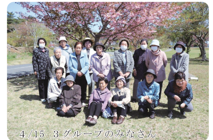
4/15 3グループのみなさん