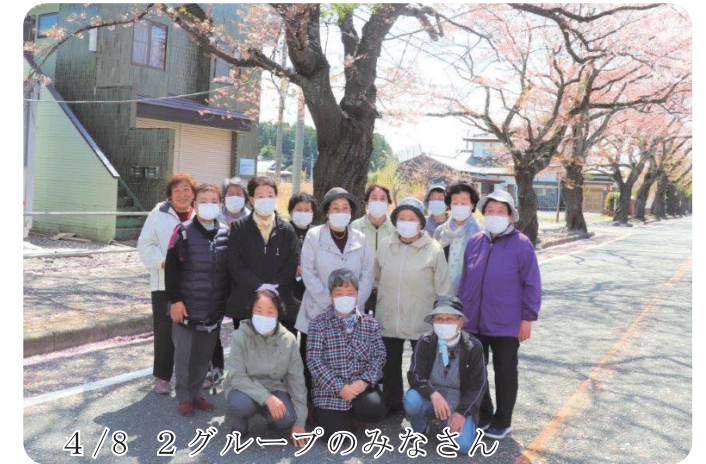
4/8 2グループのみなさん

4月は花見に出かけました。今年は開花が早く満開の花見はできませんでしたが、散策しながら参加者同士交流を楽しく過ごしてきました。