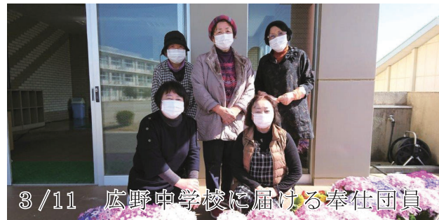
3/11 広野中学校に届ける奉仕団員