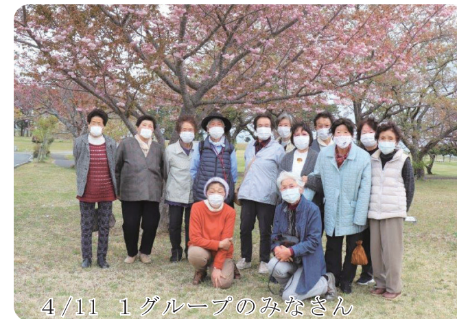
4/11 1グループのみなさん