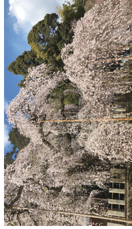
樹齢は五百年以上をほこります

今回の生きがい事業は桜を見にいわき市小川町の諏訪神社までドライブ。 満開の枝垂桜の下で記念撮影。道中もたくさん桜が花を咲かせており、とても幸せな気分になりました。 桜見物の後はランチ。すたみな太郎で好きなものを好きなだけ食べてきましたよ〜。