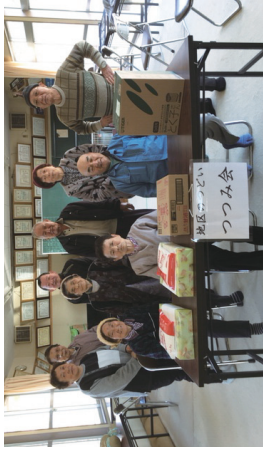
優勝チーム「つつみ会」

全15地区で毎月開催している地区のつどいにおいて、昨年11月から「公式ワナゲ交流大会」が順次行われました。優勝は「つつみ会」の皆さんでした。163名で競い合った個人賞は、2回の合計点が150点となった4名の方が同点受賞。ハイレベルな戦いとなりました。