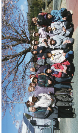
桜の木の下ではいちご

皆さん楽しみな行事の一つである日帰りドライブに行ってきた。今回はお隣の榎葉町へ桜の見物〜ランチ。残念ながら桜はまだ七分咲き。暖かくなったり真冬のような寒さになったりと満開の桜に合わせきれませんでした。その分美味しいランチをみんな食べて大満足！