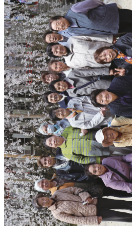
見事な枝垂桜でした