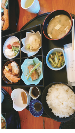
ポリューム満点おいしいランチ