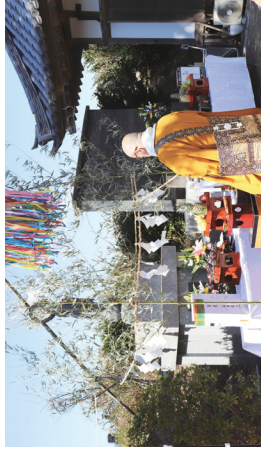
修行院住職による読経

第67回平和観音祭典が今年も春彼岸の入り執り行われました。全国的に遺族会は、遺族の高齢化に伴い会員が減少しております。しかし広野町遺族会は、当町出身である215御柱の御霊を追悼供養するため地道に活動しております。また新年度より役員も変わりました。ご確認ください。