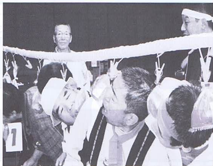
H23. 10. 15 ふれあい運動会

身体若しくは知的に障がいのある方、またその家族の方で構成されている団体です。様々な行事や研修を通して、会員間で交流を図り、親睦を深めます。普段言えない悩みや情報交換なども出来るのも一つです。興味のある方は、ご連絡ください!!