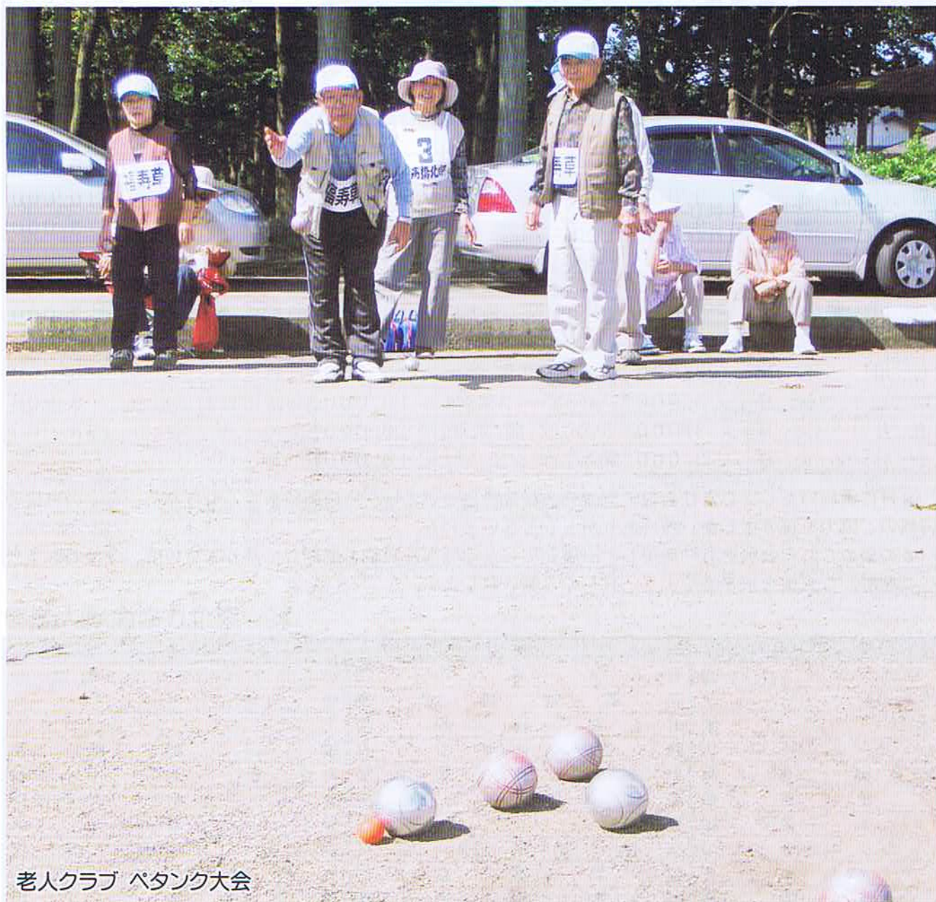
老人クラブ ペタンク大会