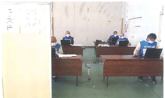
受付したボランティアやニーズ情報の入力