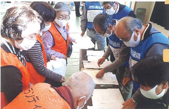
送り出し(活動リーダー、活動先までの移動手段決定)