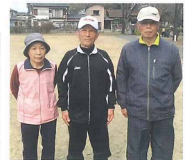
個人 入賞のみなさん