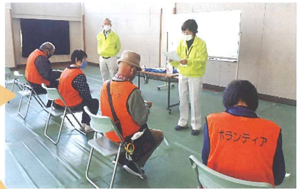
マッチング(ボランティアの活動先決定)