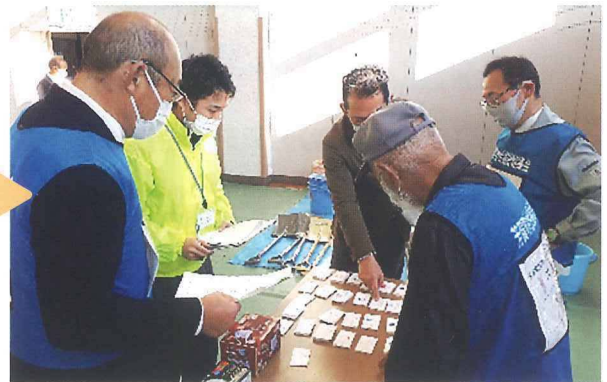
資材(資材の貸出、在庫チェック) ※今回は資材カードを代用