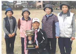
優勝 八雲会Cチーム