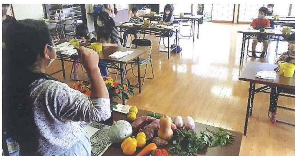
くれよん広場(絵手紙作成)