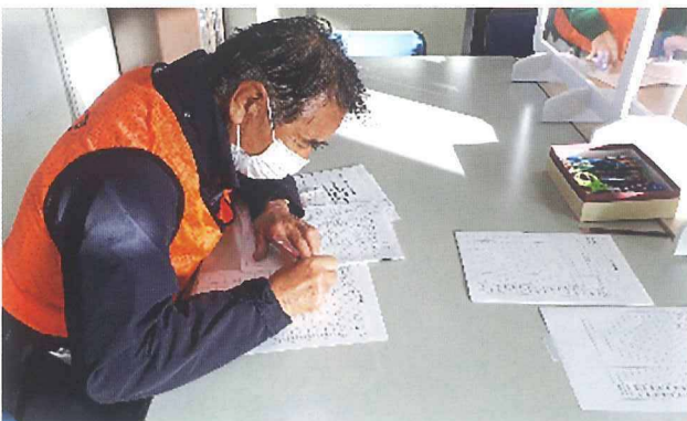
リーダーが活動報告