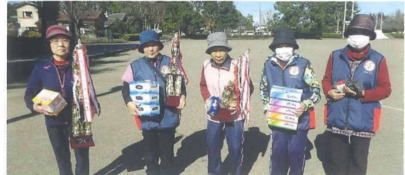
女性の部 入賞のみなさん