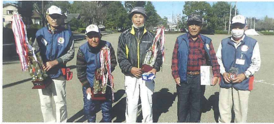
男性の部 入賞のみなさん