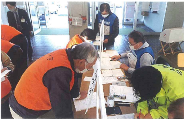
受付(氏名・連絡先、保険加入)