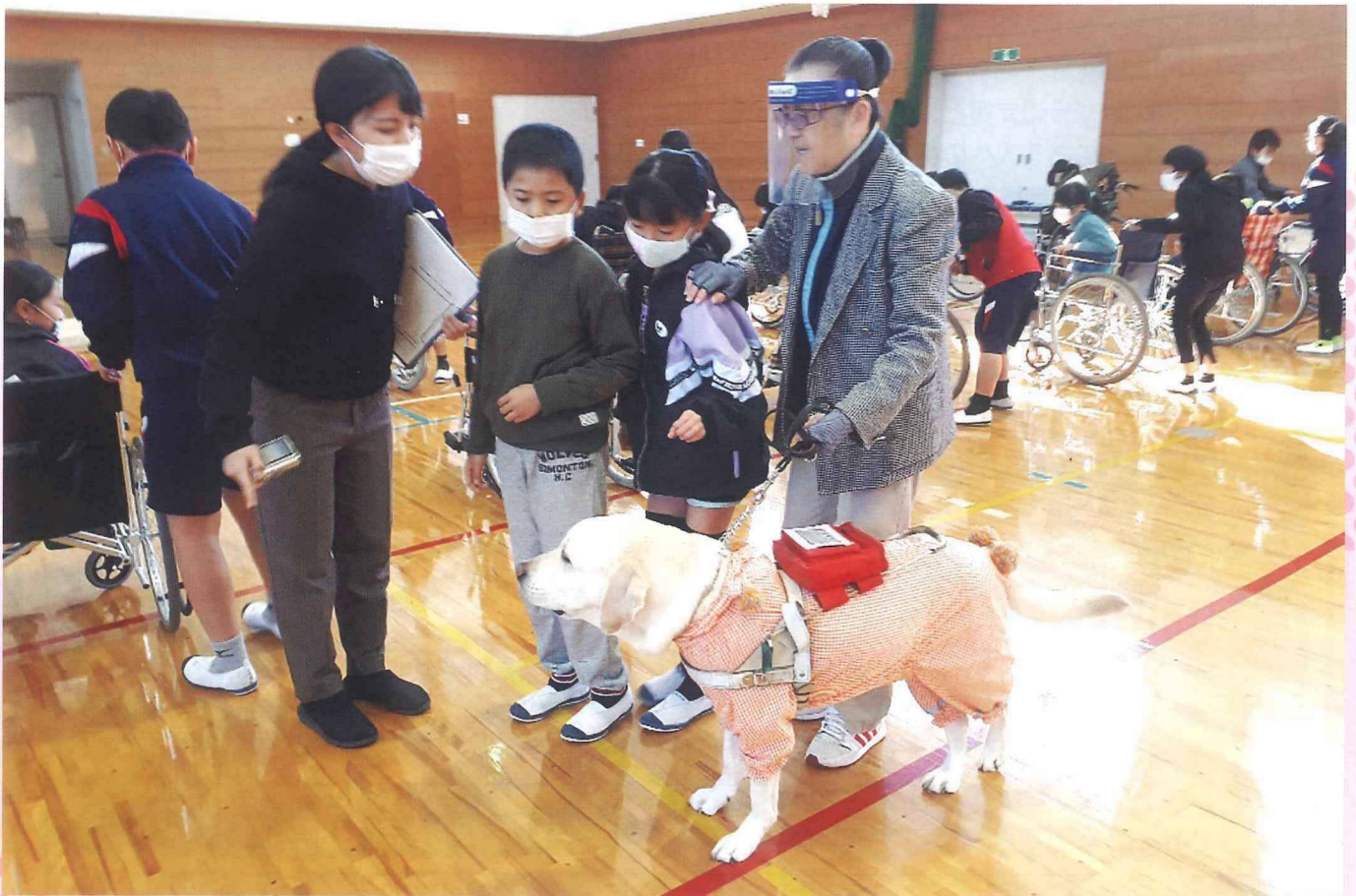
芳賀南小学校 福祉学習