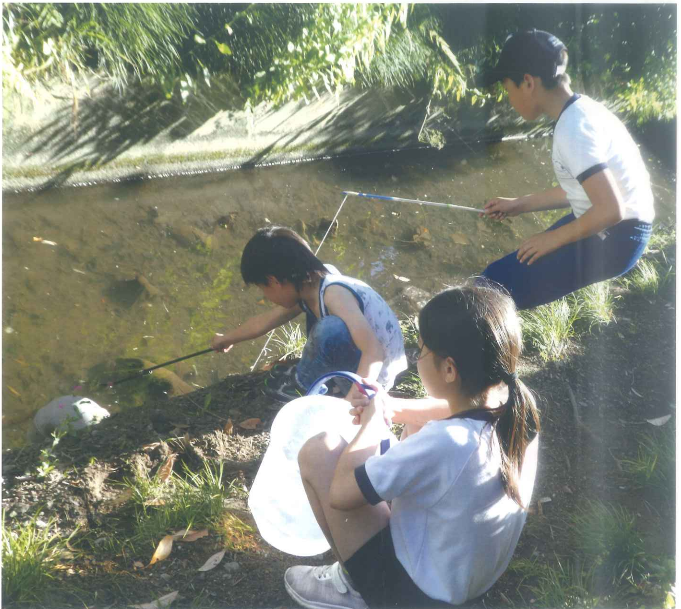
学童保育 (かひが二つり)