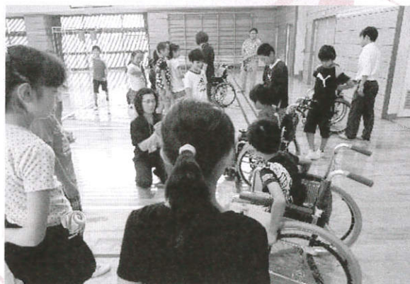
学校での福祉教育

芳賀町社会福祉協議会は町民の皆様からの会費や町補助金・受託金、共同募金及び介護保険事業での収入等にて、以下のような事業に活用しています。