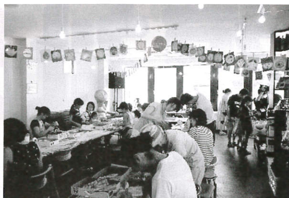
共同募金助成事業(森百貨店親子ワークショップ)