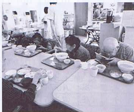
施設ラーメン振舞ボランティア