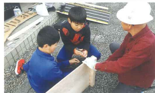
にっこり広場オリジナル看板づくり