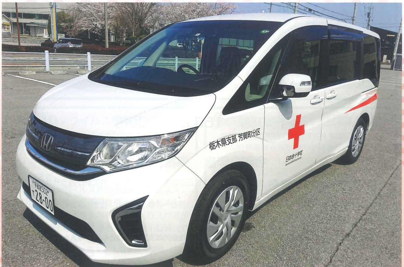
R2.3 日本赤十字社災害事務用救援車導入