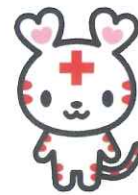
日本赤十字社 公式マスコットキャラクター 「ハートラちゃん」