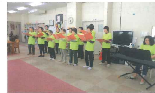
コールひばり施設での合唱