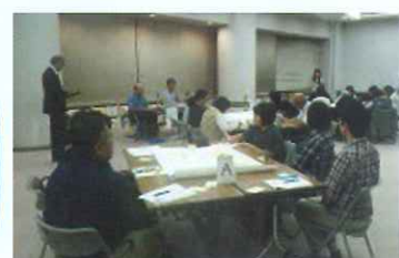
ボランティア体験講座