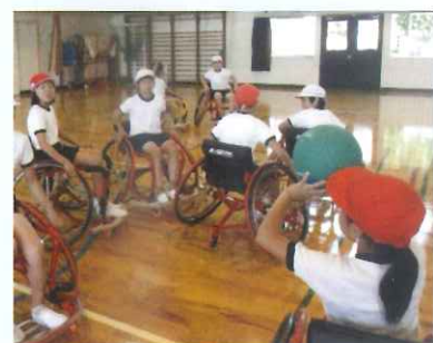
学校で福祉の授業