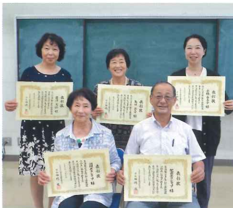
会長表彰の皆さん