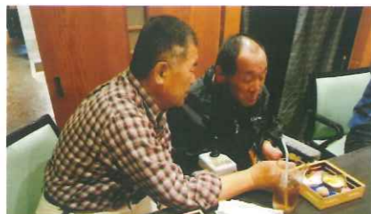
手をつなぐ親の会日帰り研修会での引率ボランティア