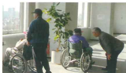
身体障害者福祉会宿泊研修会での引率ボランティア