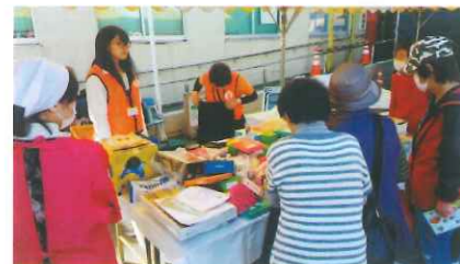
ふれあいふくしまつりでのJLCボランティア