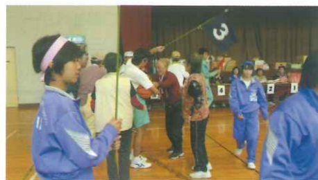
ふれあい運動会での中学生ボランティア