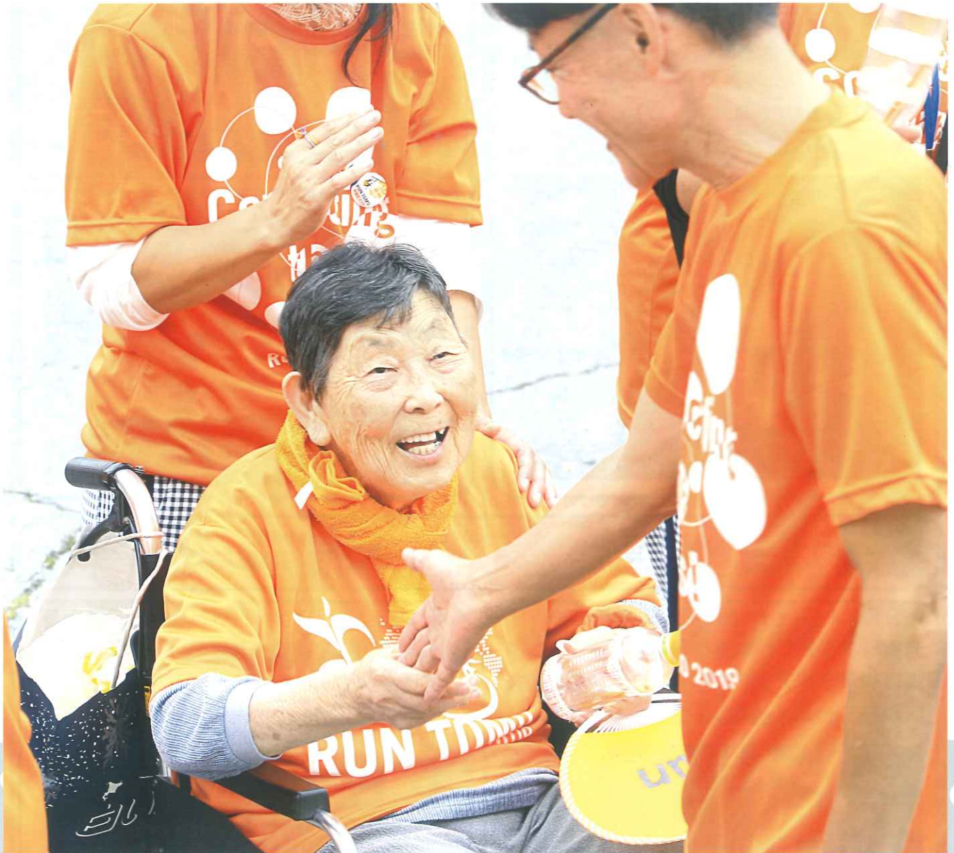
RUN 伴栃木 2019 芳賀町エリア