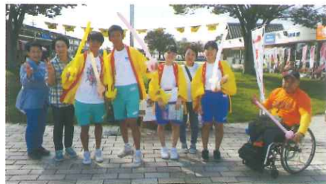
街頭募金での中学生ボランティア

また、芳賀中学校の生徒の皆さんやJLC（ジュニアリーダーズクラブ）の高校生の皆さんにもご協力いただき、活動が活性化しています。