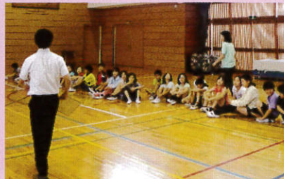
小学校での福祉の出張授業