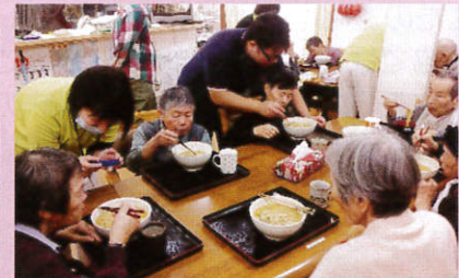
施設でラーメン振舞ボランティア