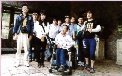
障がい者団体の皆様と宿泊研修