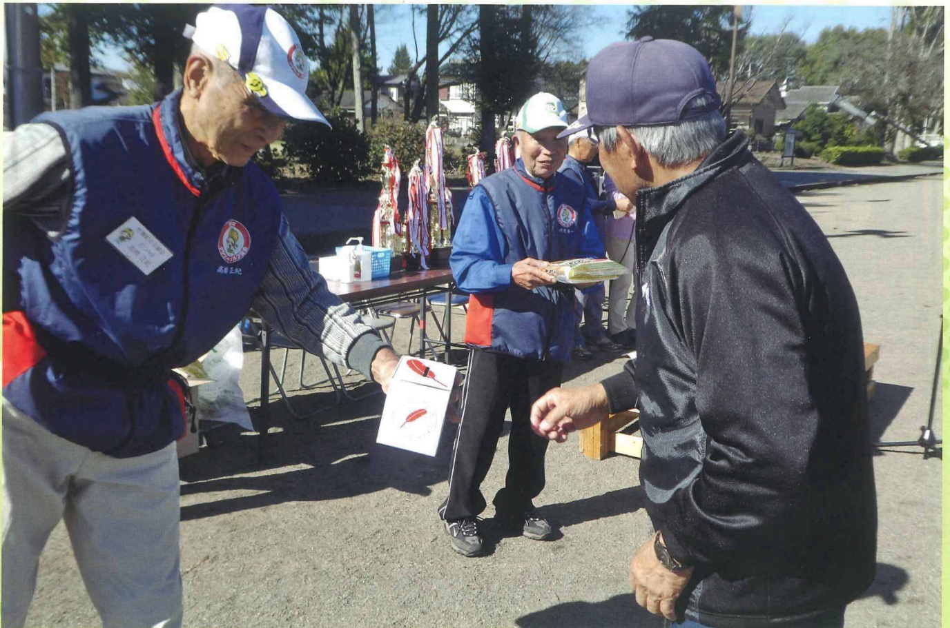
シニアクラブ ホールインワン募金