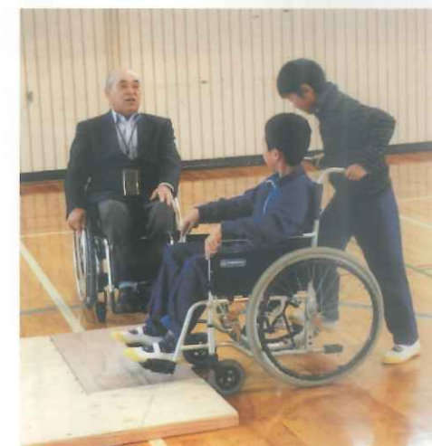
小学校での福祉教育授業