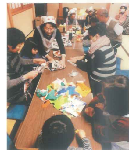
居場所(にっこり広場)