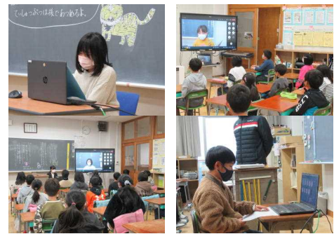
オンラインによる児童の発表

「初めて」という出来事が多いことから、何かにチャレンジするにはよい年であると思われます。また、3学期は1番短い学期ですが、勉強や委員会活動などもしっかりとまとめ、まだ身に付いていないことを確かめ、きちんとおさらいして進級・進学してほしいと話しました。そして、これからが1年で1番寒い時期ですが、植物はその寒い日を一日一日耐えながら生長し、春には立派な花を咲かせます。児童のみなさんがこの3学期に自分を鍛えて、成長していく姿を楽しみにしていますと伝えました。