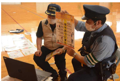
怪しい人の特徴「はちみつじまん」