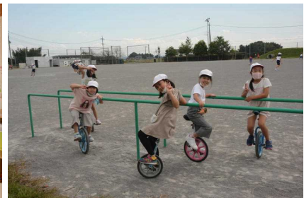
一輪車で遊ぶ児童