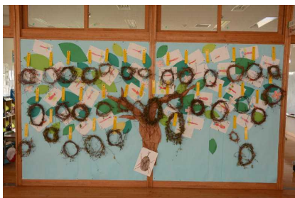
1年生のアサガオリース