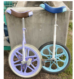
寄付していただいた一輪車