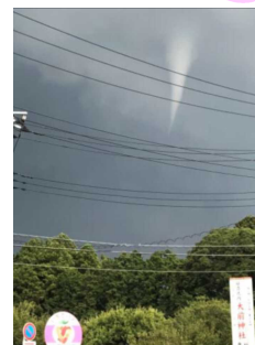
ウェザーニュースより

7/21(水)から8/31(火)まで42日間の夏休みです。健康で有意義な夏休みになりますよう、御協力をお願いいたします。また、7/27(火)～8/3(火)までは個人面談です。1学期の学習や生活について懇談し、今後の学校生活に役立てたいと思います。よろしくお願いいたします。