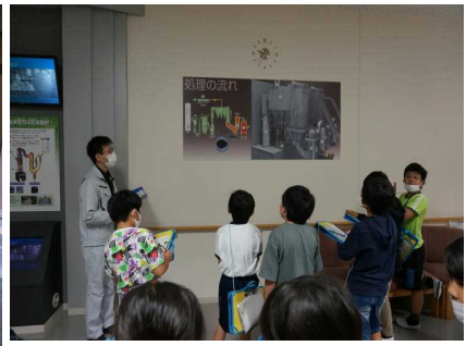
エコステーション2