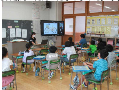
教室聞く児童の様子