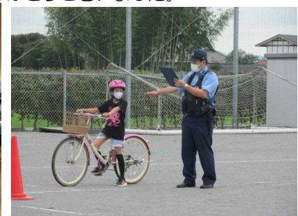
自転車練習の様子

今年は、昨年に比べ県内の小学生の交通事故は減っているそうです。しかし、夏休みに入るとすぐに交通事故が起きたこともあります。夏休み中は、子供たちの自由な時間がいつもより多くなります。交通安全について、そして、命の大切さについて御家庭でも御指導をお願いいたします。