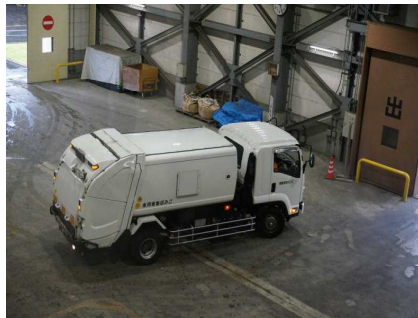
エコステーション1