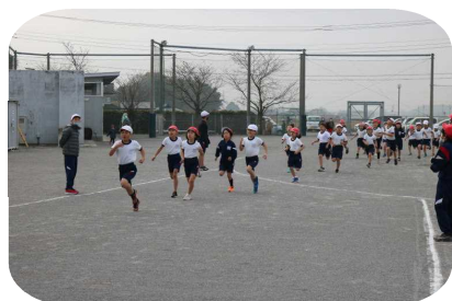
校門を出ていよいよ校外へ