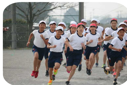
力強い6年生のスタート

大会運営に御協力いただいたPTA本部役員・体育厚生委員の皆様、応援に駆けつけてくださった保護者、地域の皆様に改めて感謝申し上げます。