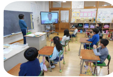
ミニ人権教室2年生