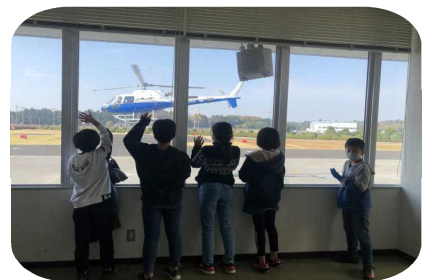
友達のフライトを見送る

薬物乱用防止教室 12月1日(火)、5年生が薬物乱用防止教室に参加しました。警察官から、話を聞いたり動画を見たりして、薬物には絶対に手を出さない心構えができました。