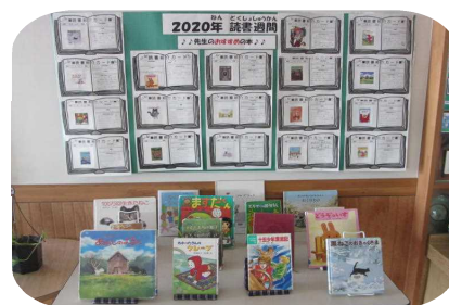
教職員の推薦図書

12月10日の世界人権デーに先駆け、11月中旬から人権の啓発を行っています。例年のように全児童が一堂に会して行う「ハートフルみなみ」はできないため、学級ごとにミニ人権教室を行いました。今年度も保護者の皆様の御協力により、すばらしい人権標語も集まりました。これまでも、保健安全委員会がコロナ感染者への偏見や差別を無くすシトラスリボン活動を行いました。この後も、性差別をなくするためのジェンダー川柳募集など、子どもたちの心を耕す活動を続けていきます。