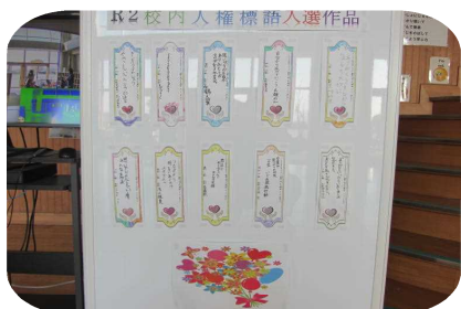
家族で考える標語～思いやり～