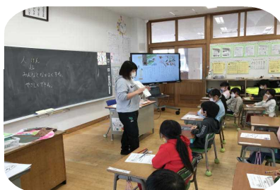
ミニ人権教室1年生