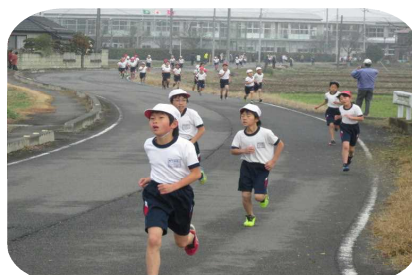
間もなく折り返し