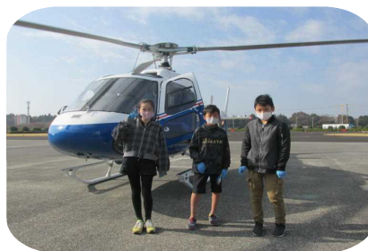
ヘリコプターの前で