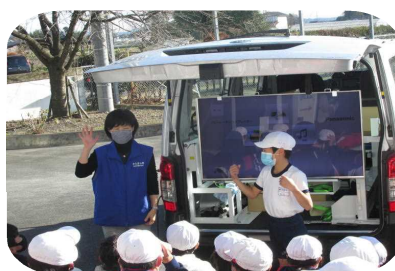
薬物の怖さの話を聞く5年生

薬物乱用防止教室 12月1日(火)、5年生が薬物乱用防止教室に参加しました。警察官から、話を聞いたり動画を見たりして、薬物には絶対に手を出さない心構えができました。