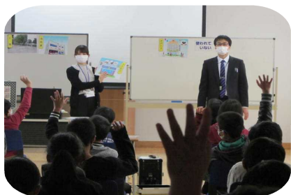
質問に答える6年生

租税教室 12月9日（水）、6年生が租税教室に参加しました。実物大の模型から1億円の重さや量を感じとして捉え、その後、税金にはどんな種類があるか、何に使われる