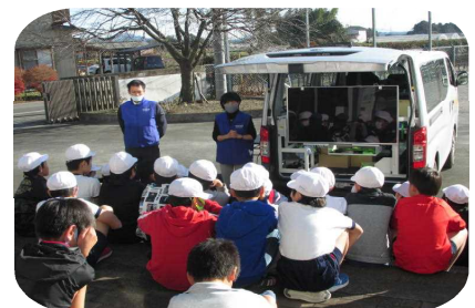
きらきら号で動画視聴