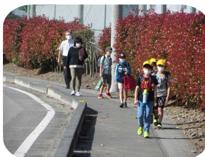
バス乗車の職員と一緒に登校