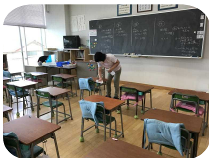
職員による机・椅子の消毒

A・B2班に分かれての登校のため、全員の友達と会えるのは、もう少し先になりますが、家ではできない友達や先生との関わりの中での学びを大切にしていきたいと思います。また、引き続き、感染防止の対策を徹底して教育活動を進めて参りますので、御理解・御協力をお願いいたします。