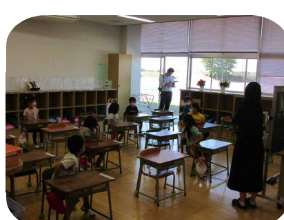
下野新聞の取材を受ける1年生