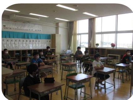
密接を避けた教室の座席