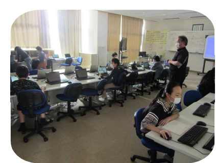
ジャストスマイルの使い方指導