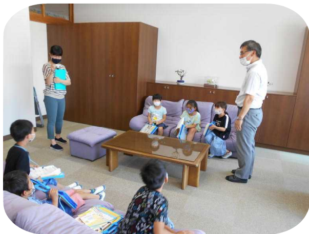
校長室でリラックス

6月10日（水）、2年生が1年生を案内して、学校探検を行いました。昨年は案内してもらう立場だった2年生は、1年前を思い出しながら頑張って1年生を案内し、的確な説明をしていました。2年生のお陰で、一層学校になじむことが出来た1年生でした。