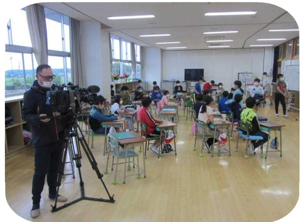
撮影のワンシーン