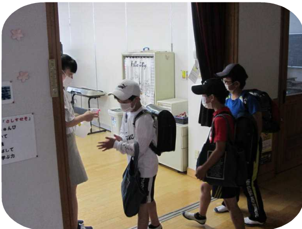
手指消毒をして教室に入る5年生

6月1日(月)、NHK宇都宮放送局の取材がありました。「新しい生活様式」を踏まえて学校がどのような工夫をしているかがテーマでした。大人数で密になってしまう5年生の教室を広い多目的室に移して授業を行っている様子、出入り口の扉を取り外して換気を良くしている様子、教室に入る前に担任がアルコールで手指消毒を行っている様子、スクールバスの密を避けるためにピストン輸送をしている様子などを撮影し、夕方のニュース630で放送されました。NHK宇都宮放送局の取材は4月の始業式に続いて2回目です。