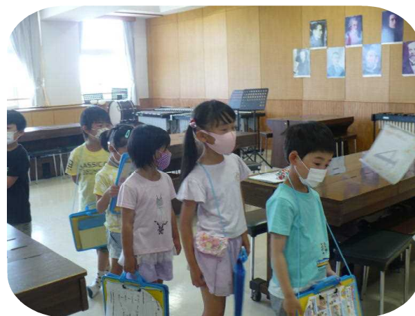
音楽室にて、早く大きな声で歌いたいね。