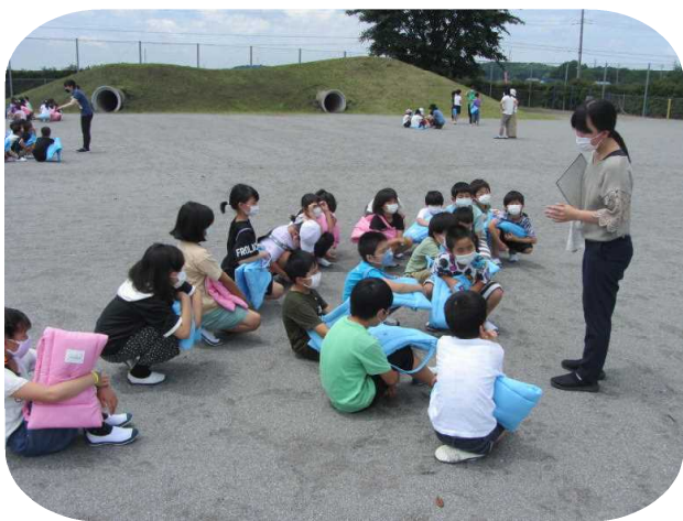
振り返りを行っている3年生