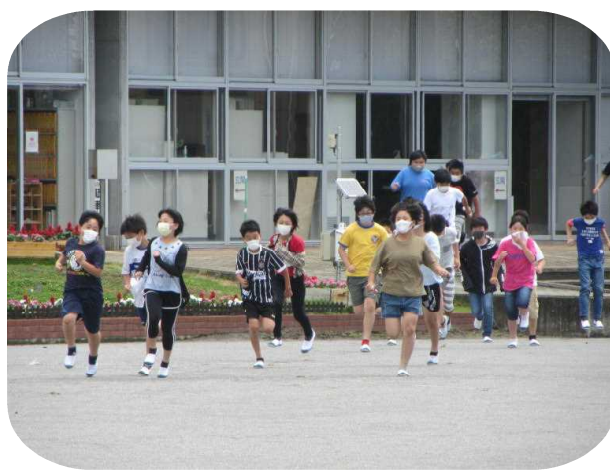
真剣に避難する6年生