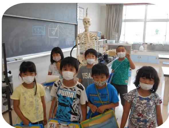
理科室骨格標本の前で