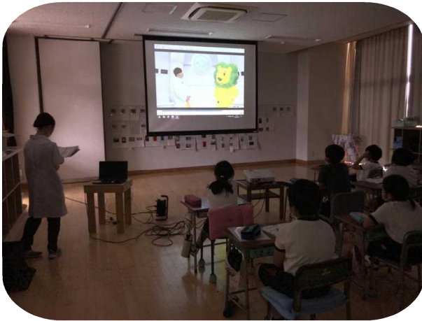
健康な歯茎について学習する5年生

健康な歯茎の特徴について、動画を元に学びました。本来なら、各自が手鏡で自分の歯茎を確認するのですが、今年は、コロナウイルス対応で、実施しませんでした。授業の終末に、将来の夢未来宣言カードを記入しました。夢を実現するためにも、健康な歯はかけがえのない条件であることを学んだ5年生でした。未来宣言カードは保健室の廊下に掲示されます。