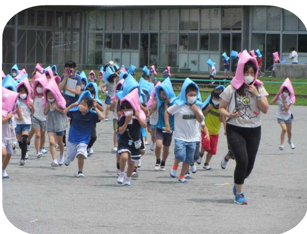
全力で避難する2年生

先生や友達が近くにいなくても、これらの決まりを守って、絶対に大切な命を失わないでほしい。自分の命を自分で守れる人になってほしいと伝えました。