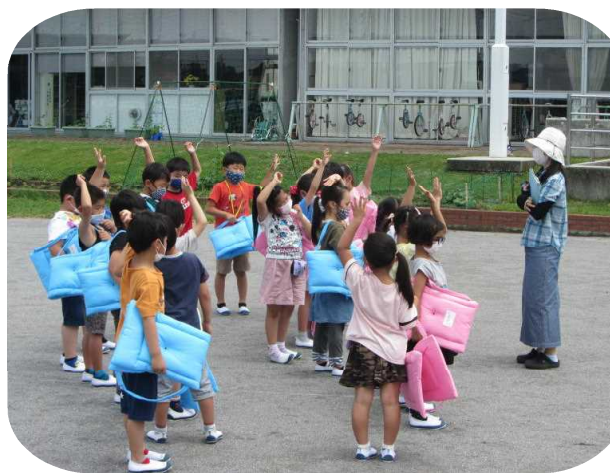
出来たことを確認する1年生