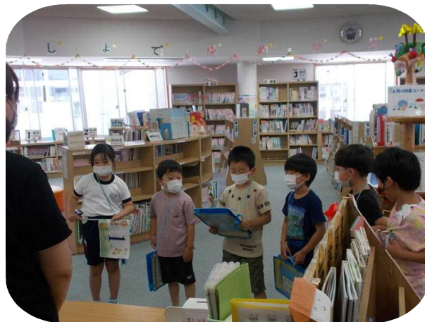
図書室の説明を聞く1・2年生