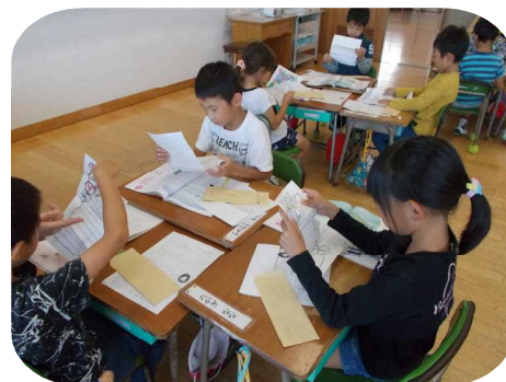
保護者からの手紙を真剣に読む1年生