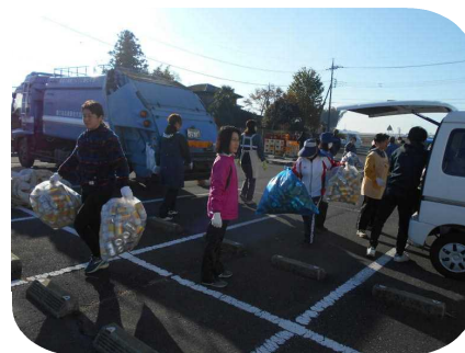
アルミ缶を運ぶコマ

回収資源の益金につきましては、子供たちの教育活動に活用させていただきます。金額等が確定いたしましたら、「芳賀南小学校便りだより」でお知らせいたします。