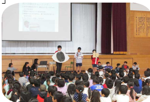
「目」の仕組みについての発表

約1ヶ月間頑張ってきた委員会の子供達の表情は、達成感にあふれていました。聞いていた子供達からは、「おもしろかった」「すごかった」という声がたくさん聞こえてきました。南小の健康リーダーが着実に育ってきています。