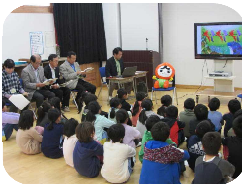
紙芝居を見つめる3年生

人権擁護委員の皆様が、電子紙芝居「白い魚とサメの子」の役割朗読をしてくださり、心に残る人権教室となりました。