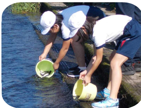
大きく育て! 願いを込めて

前日まで川の水位が高く、実施できるか心配していましたが、当日は、ほぼ、いつもの水位に戻っており、予定通りに実施しました。野元川に放され、一目散に泳ぎ去る魚や、近くにとどまっている魚などを発見し、「元気でね!」と、優しい言葉をかける児童もいました。こんなところでも「命」にふれた、3年生でした。