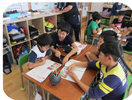
グループで議論する5年生

今後、保護者の皆様にも調査に御協力いただき、保護者の皆様の思いも取り入れた、授業計画を作成し授業を行っていきたいと思います。