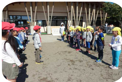
年長さんとおあいさつ

来年の春に、年長児が少しでも安心して入学できるようにと、1年生も精一杯がんばってくれました。