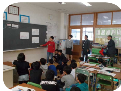
友達の発表に補足する5年生