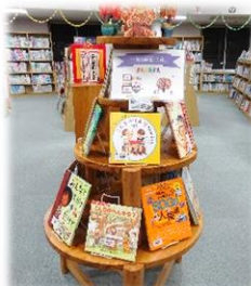
↑ 人権の本のコーナー