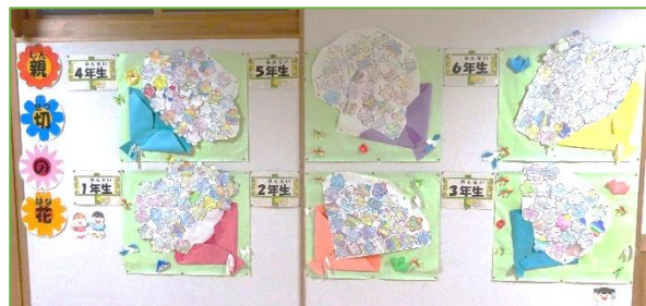
↑ 全児童のありがとう「人権の花」の掲示