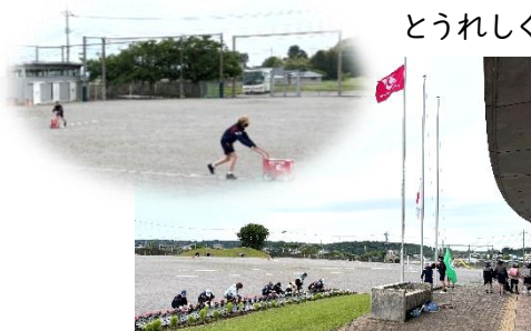
↑ 朝から活躍中の各委員会の児童たち