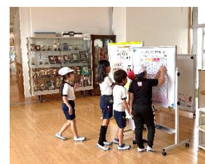
↑ 校長賞の発表を見る児童

さて、今年も校長賞の表彰を行うことにしました。「よく学ぶ子」「豊かな子」「たくましい子」「ともに生きる子」それぞれに一人一人のよさを認め、子供たちの励みになるとよいと思っています。受賞した子供たちは、校長室で撮った写真と鉛筆またはカードを持ち帰りますので、御家庭でもおおいにほめていただければと思います。