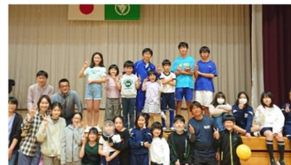
何にもしない合宿 4/26 みなみの和の会

今年も地域との協働についてお知らせしていきます。各活動の詳細や写真などは、ホームページで公開していますのでご覧ください。