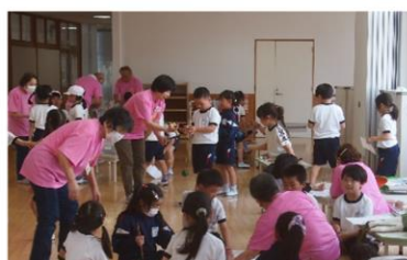
イベント昔遊び 5/16 みなみの会にじ