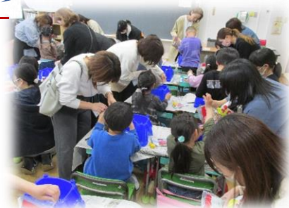
1年生 アサガオの種まき