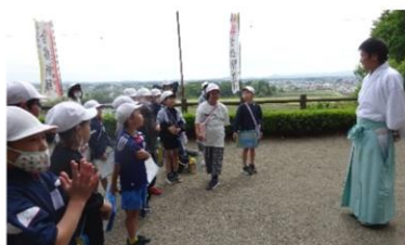
3年生 学校周辺の探検 4/30 西水沼天満宮

また、地域のお祭りやイベントなどでも、地域とのつながりを感じながら学校では学べないことを体験する児童も多いと思います。地域の行事へ参加を促す声掛けを御家庭からお願いいたします。