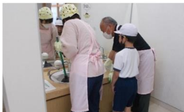
清掃ボランティア 5/13 みなみの会にじ