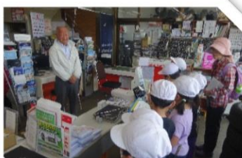
塩田屋がソリスタント