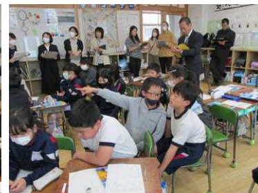
4年2組 考えの伝え合い