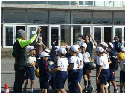
3年生「サッカー教室」

自由参観にお越しいただきました保護者・御家族の皆様、教育関係の皆様には、子供たちの様子を御覧いただきありがとうございました。