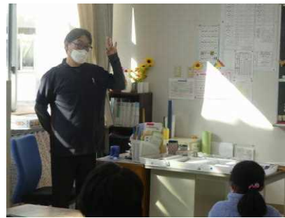
たんぼぼ・ひまわり・2年生「歯の健康について」