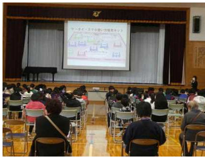
4～6年生「ネット時代の歩き方講習会」