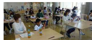
1年生親子食育講話