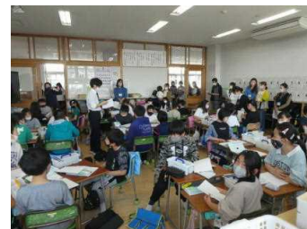
1年生の親子交通安全教室 2学級から1学級編成となった5年生

また、1年生は真岡警察署の御協力を得て、「親子交通安全教室」を実施しました。この様子は、NHK、栃テレ、芳賀チャンネルで放映されましたが、道路の横断を疑似体験できるシミュレーターを使って、安全な歩行について学びました。親子で交通安全に対する意識を高めるよい機会となったことと思えます。