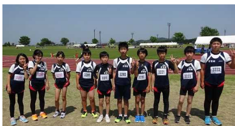
出場した10名の選手たち

真岡市総合運動公園陸上競技場において、芳賀地区の陸上記録会が開催されました。今回、本校からは校内の練習会に参加し、大会出場のための標準記録を突破した10名の選手（5/6年生）が出場しました。気温が30℃を超える大変暑い日となりましたが、体調を崩す児童もなく今までの練習の成果を十分に発揮しました。なお、入賞した2名の選手は6/18(日)に開催される県予選会に出場となります。