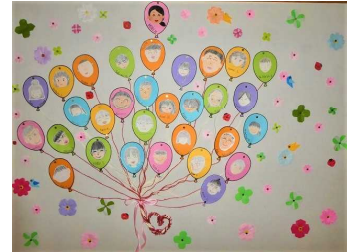
6年生の似顔絵風船

来週24日は修了式になります。5年生が新しいリーダーです。すでに3月1日から登校班の班長が5年生以下の児童に代替わりしています。また、5年生は「6年生を送る会」を立派に運営するなど、徐々に最高学年としての自覚が芽生えてきています。1年生から4年生も見違えるほど、たくましくなりました。令和5年度の活躍を今から楽しみにしています。