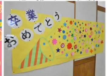
下級生の教室の廊下に掲示されたお祝いのメッセージや飾り付け(ほんの一部です)