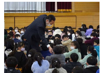
お世話になった人は？

また、感謝の「謝」の字は、「言う」と「射る」からできており、「射る」には矢がまっすぐ跳ぶ様子から「実直」とか「素直」の意味があり、感謝とは「感じたことを素直に伝えること」と話しました。たくさんの方々に支えられ成長できたことに感謝し、1年間のまとめとしたいと思います。