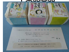
お米「芳賀のめぐみ」 卒業証書ファイル 芳賀町より