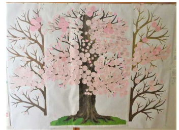
6年生への感謝のメッセージの桜が満開