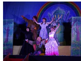
夢団によるミュージカル「オズの魔法使い」