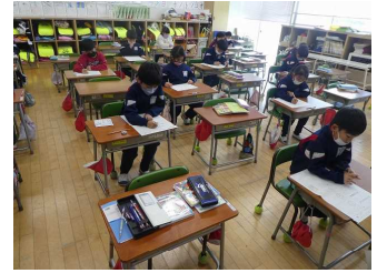
1年生（2教室に分かれて実施）