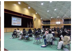
中学校での説明会