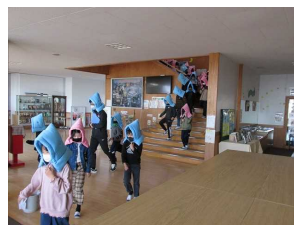
「おかしもち」を守って避難

真岡消防署芳賀分署の皆様にご協力と御指導をいただき、本年度最後の避難訓練を実施しました。今回は、大地震後に火災が発生するという二重の災害に対して、また、煙が充満し視界が遮られた場合においてもパニックにならずに落ち着いて避難できることをねらいとして実施しました。子供たちは、自分の命は自分で守ることを強く意識し、真剣な態度で取り組むことができました。