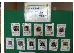
読み聞かせボランティアの紹介ボード

保護者の皆様、地域の皆様には、本校教育活動の充実に大変お世話になっております。心より感謝申し上げます。