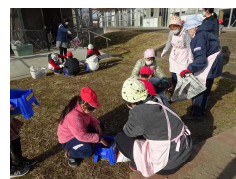
チューリップの球根植え