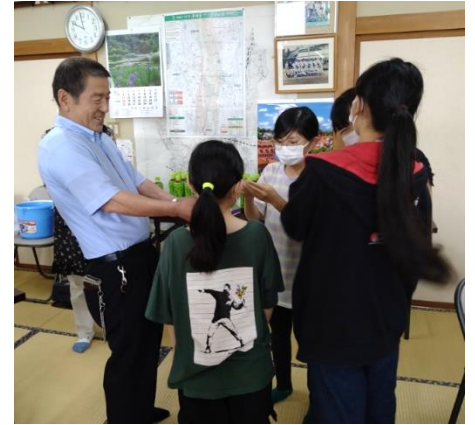
6/25（日）芳志戸自治会事業「囲炉裏」に参加した本校児童

新型コロナウイルス感染症が5類に移行し、夏祭りなどの地域行事も4年ぶりに制限なく開催することができるようになりました。コロナ渦でここ数年地域での交流が減少していたので、児童が地域活動へ積極的に参加するように声かけしています。児童が地域の方々と一緒に活動することで、芳賀町への愛着や誇りを持たせ、郷土愛の醸成につなげられればと考えています。保護者の皆様におかれましても趣旨を御理解いただき、お子様と一緒に地域行事・活動に御参加いただければ幸いです。