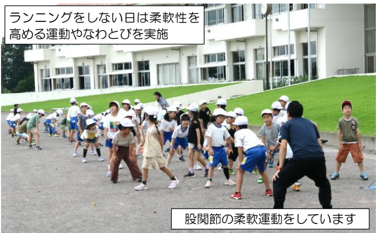
ランニングをしない日は柔軟性を高める運動やなわとびを実施