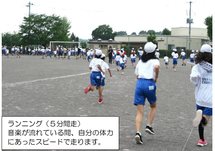
ランニング(5分間走) 音楽が流れている間、自分の体力にあったスピードで走ります。