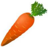
キャロット (にんじん)