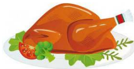
ターキー (しちめんちょう)