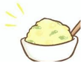
マッシュ ポテイト