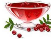
クランベリーソース