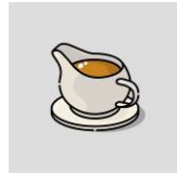
グレービー (おにくのソース)