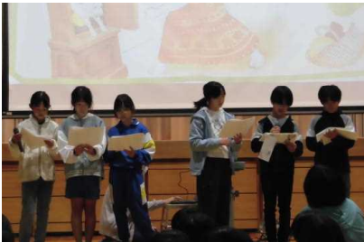
【読書まつりの様子】

11月4日(火)から14日(金)まで、校内読書週間として図書委員会を中心に読書の啓発を行いました。10日(月)には、校内読書まつりとして、図書委員会から工夫を凝らしたとても楽しい発表がありました。また、「家読カード」を図書室前廊下に掲示させていただいています。本校の児童は、たくさん読書をし、図書室をよく利用しています。司書の先生、図書委員のみなさん、ありがとうございます。