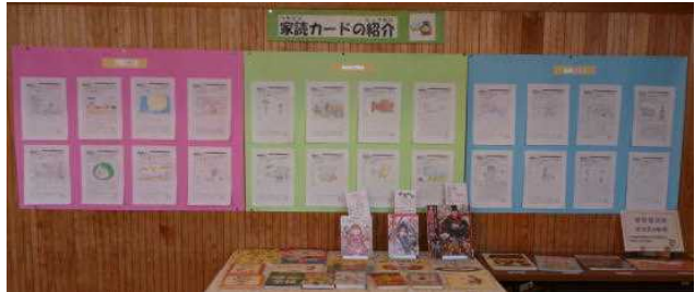
【家読カードと本の紹介】