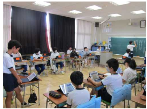
6年1組「運動会のスローガンを考えよう」

そこで、本校では子どもたちの自主的・実践的な活動を大切に、自分たちの力で問題解決できる子どもの育成に力を入れています。そのために、子どもたちが問題を発見し、その解決策について話し合い、折り合いを付けて合意形成をする「学級活動」の「話し合い」を大切にしています。この学習は家庭での一人の学びでは得られない「学校でしか味わえない学び」です。ここで学習したことは将来の様々な集団での生き方につながるものです。今後もこのような学びを推進し、学校生活の充実と向上を図ってまいります。