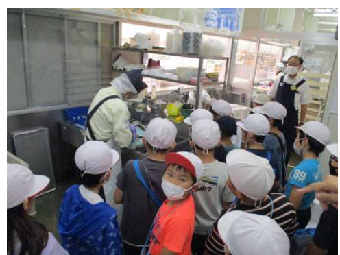
3年スーパーマーケット見学「たいらや芳賀店」