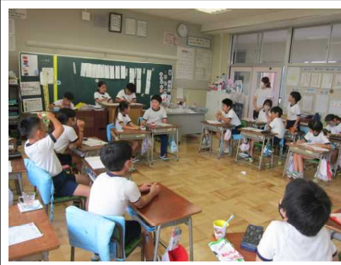
4年1組「クラスのよいところを紹介しよう」