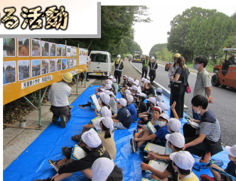
4年道路工事見学「小金建設工事現場」

本校では、「地域の教育資源を活用した学習の実践」に取り組んでいます。9月に実施した「地域を知る活動」について紹介します。