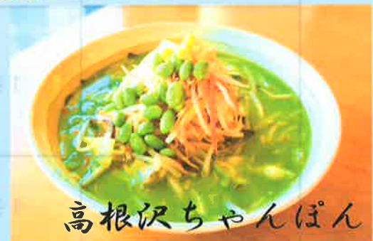
高根沢ちゃんぱん