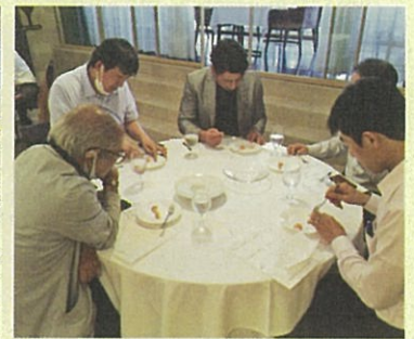
養殖ザリガニの試食会