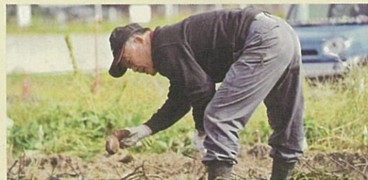
さつまいもの収穫作業