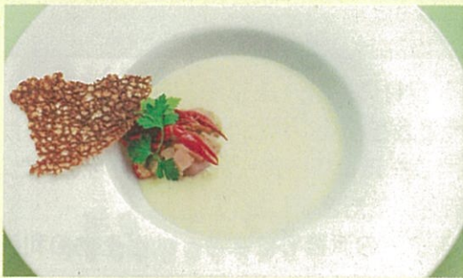
金谷ホテルで提供されているロイヤルポターージュ