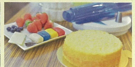
ドリームケーキキット