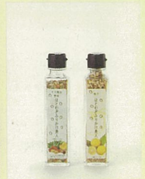
「はとむぎふりかけ美人」