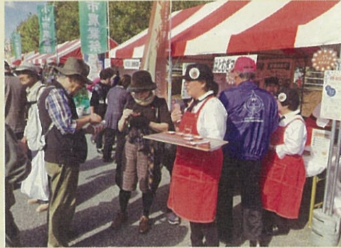
小山市農業祭への出店