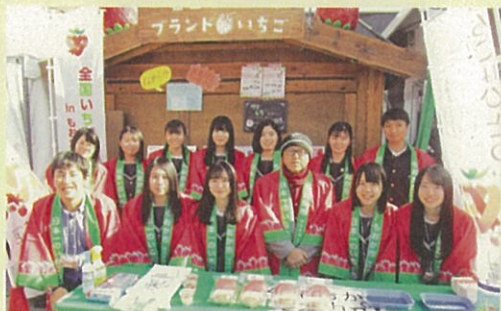
ヨコハマストロベリーフェスティバルへの出店