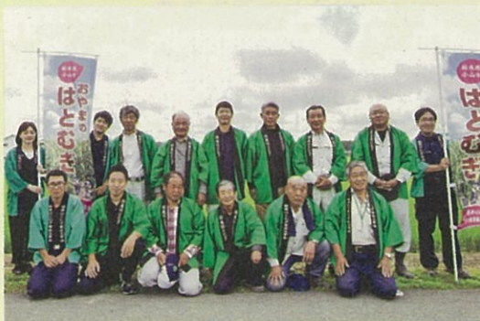
小山はとむぎ生産組合