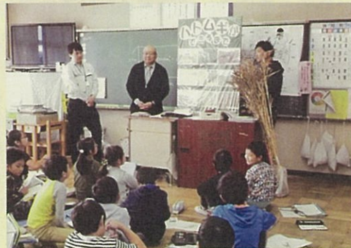
小学校での授業風景