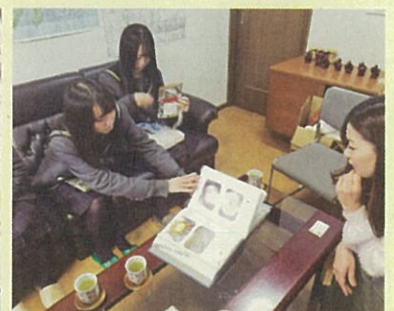
食品企業との商品開発打合せ