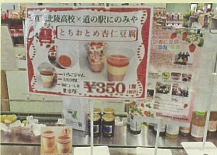
生徒が開発した「とちおとめ杏仁豆腐」