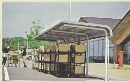
ドライブスルー販売