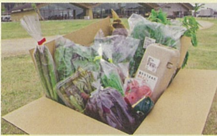
ドライブスルー販売した野菜ボックス