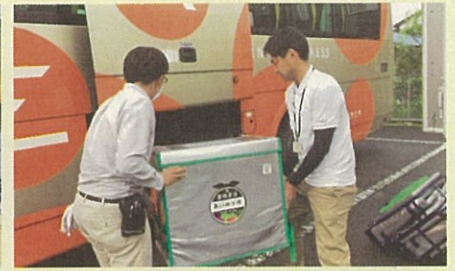
高速バスでの貨客混載事業