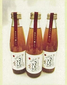
はとむぎを使用した「ベっぴんコーラ」