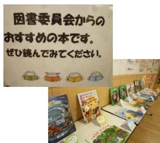
「おすすめの本コーナー設置」